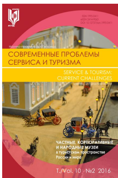
Современные проблемы сервиса и туризма

Важнейшее направление деятельности Издательства РГУТИС – выпуск периодических научных изданий – журналов, основателем которых является Университет. Кроме селевого научного журнала " Сервис в России и за рубежом ", также издаются журналы: